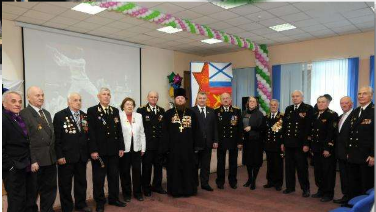
День Защитника Отечества в школе №44. 2016 г.