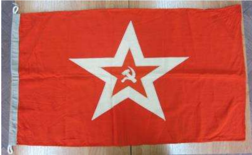
Гюйс ВМФ СССР