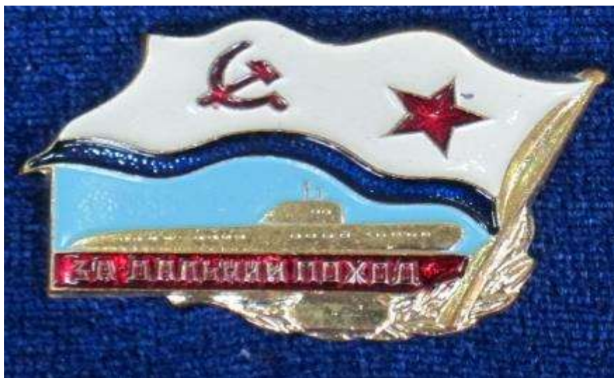
Знаки за дальние походы