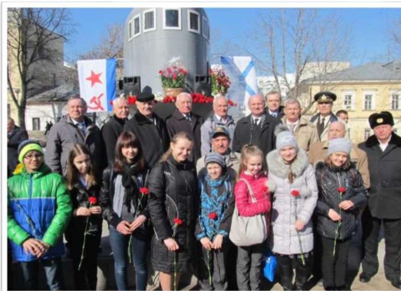
У подводной лодки С-13 наши герои со школьниками