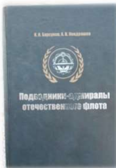
Книга «Подводники- адмиралы отечественного флота»