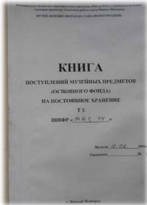
Книга поступлений музейных предметов на постоянное хранение