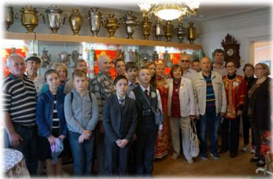
Награждение директора краеведческого музея города Темникова. ( Мордовия)