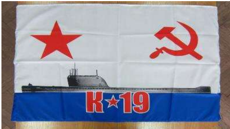
Юбилейный флаг К-19