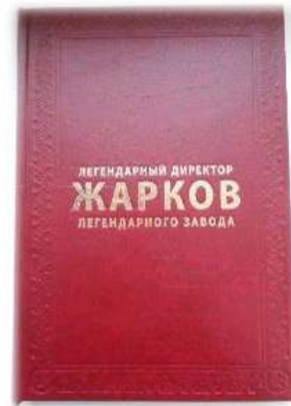
Книга «Жарков. Легендарный директор легендарного завода»