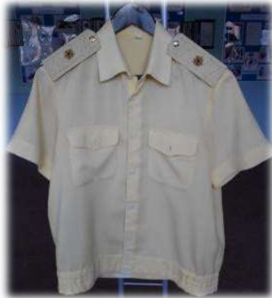
Кремовая рубашка с коротким рукавом