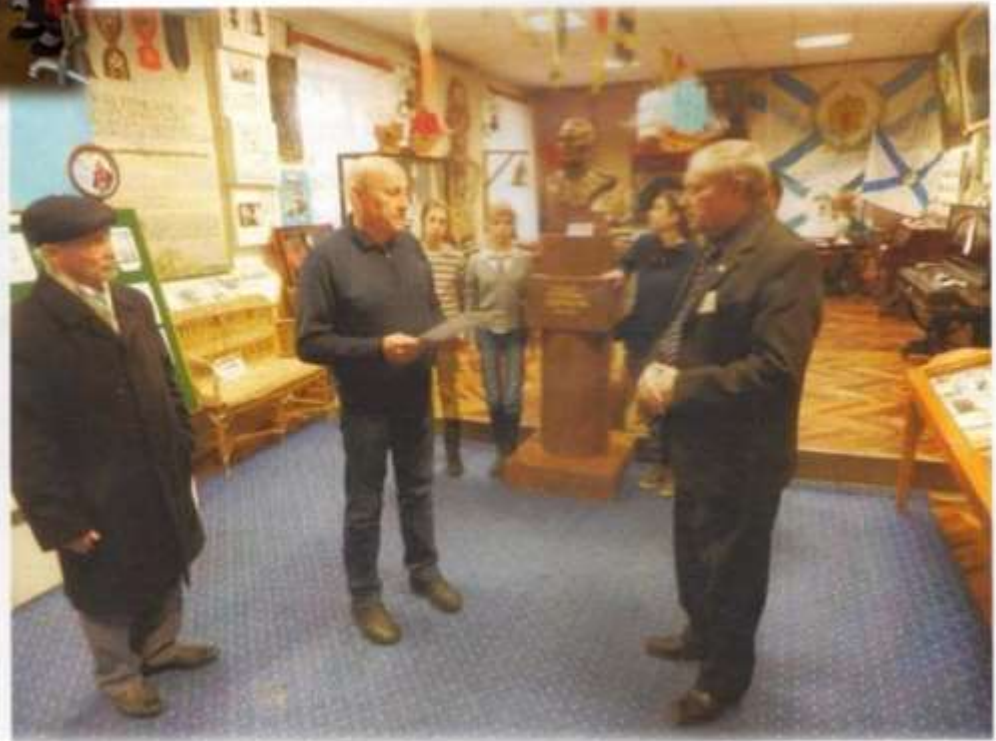
Ветераны вместе с детьми в музее самоваров. Городец.