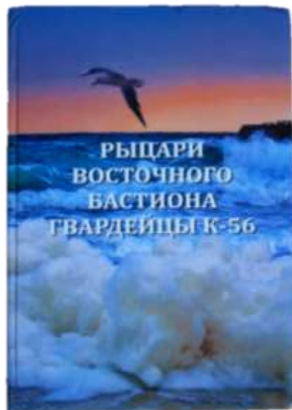
Книга «Рыцари Восточного бастиона. Гвардейцы К-56»