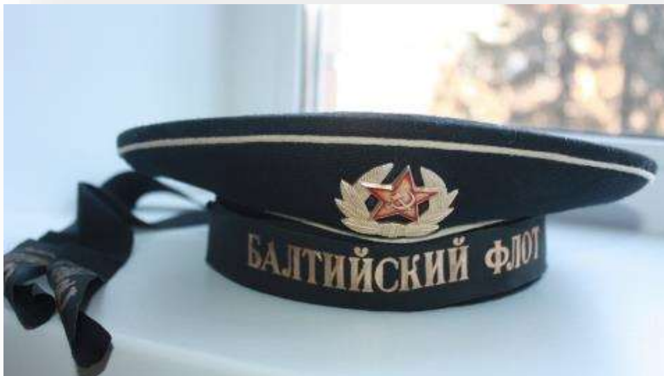
Бескозырка - форменный головной убор матросов и курсантов