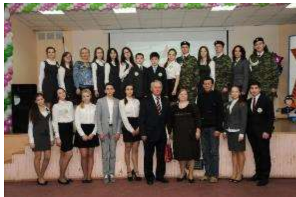
Участники первого фестиваля военно-патриотической песни