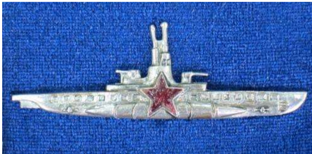
Знак командира подводной лодкой