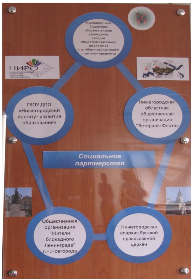
Схема сотрудничества нашей школы по созданию музея