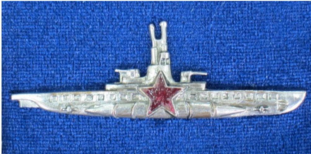
Знак командира подводной лодки