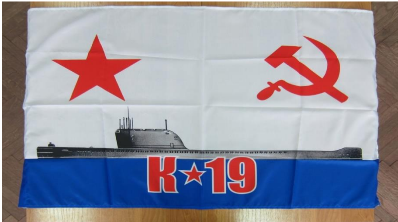
Юбилейный флаг К-19