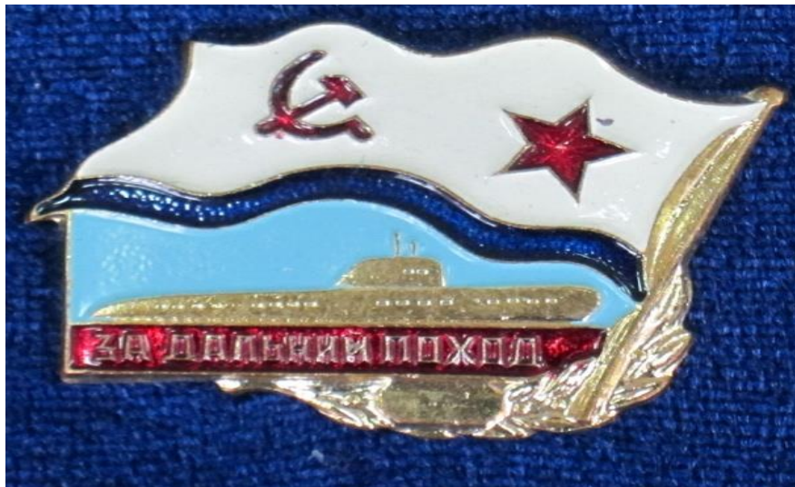
Знаки за дальние походы