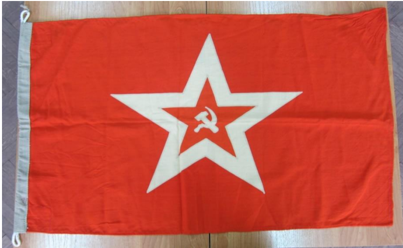
Гюйс ВМФ СССР