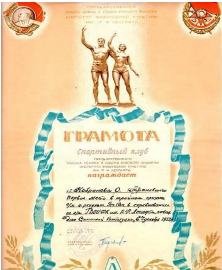
Грамота спортивного клуба Института Физической Культуры им. П.Ф.Лесгафта за первое место в тройном прыжке на соревнованиях по легкой атлетике.