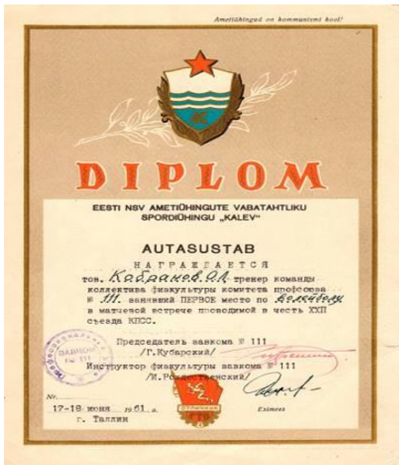
Грамота тренеру коллектива, занявшего 1 место по волейболу. 17-18 июня 1961 года. г. Таллин, Эстонская ССР.