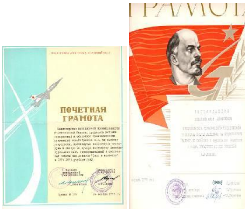
Почетные грамоты преподавателю Авиационного техникума за высокие результаты в подготовке коллектива техникума и плодотворную работу по обучению и воспитанию. Город Горький, 1970-1975 г.г.