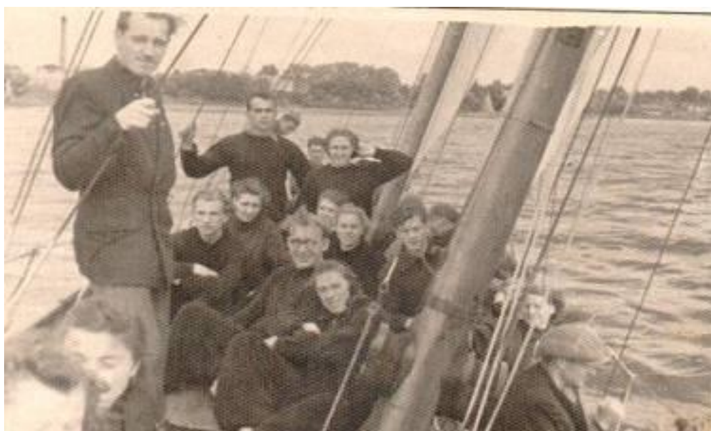
Фото из поездки на тренировочный сбор г. Пярну ЭССР с авторскими комментариями.

На производной яхте Ямского порта в гиллеровской Германиф. (своим ходом дошедшей до Таллинна.) Участники тренировочного сбора легкоборцев ЭССР г. Пярну ЭССР. Я в центре, в отцах. Июль 1953 г. На контрольных соревнованиях я занял место второе место в десятиборьи.